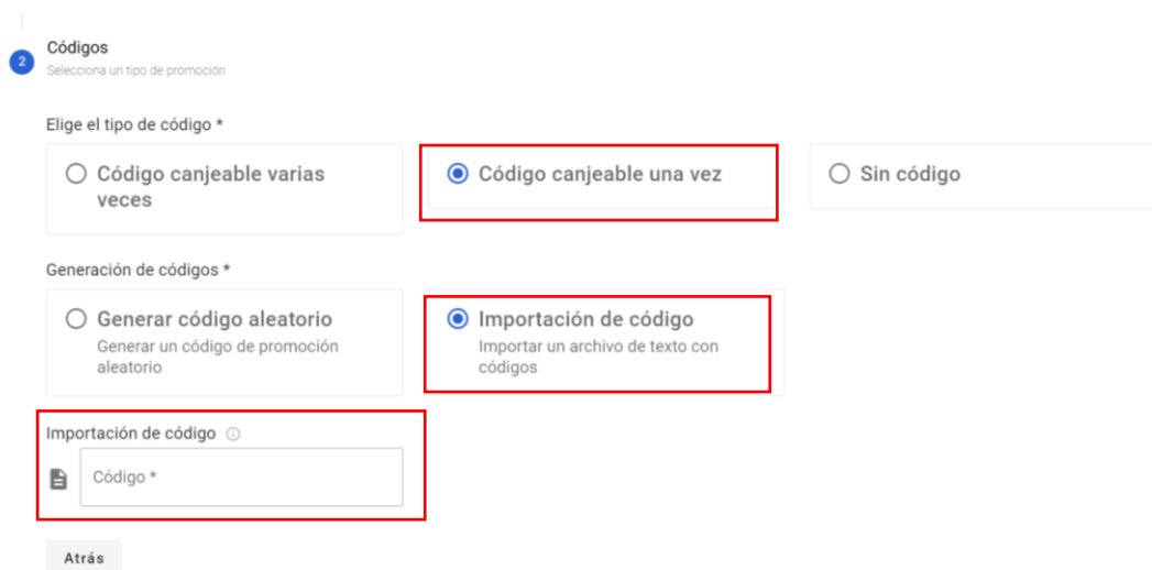
Imagen 4 Ver código de selección canjeable una vez e importar código

No hay caracteres especiales, excepto "-"