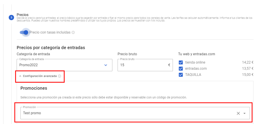
Imagen 6 Ver selección de promoción para el precio de la entrada